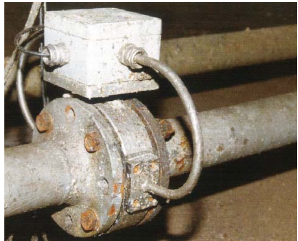
Prozess – Sensor Ex 1988